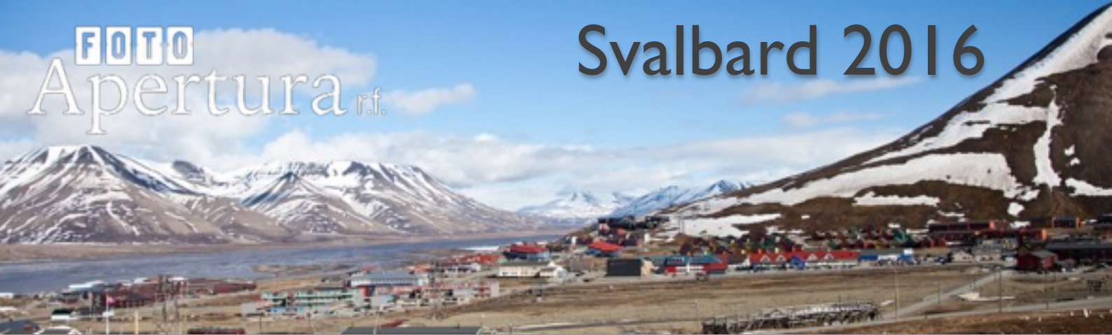
Foto Apertura r.f. ordnar en resa till Svalbard och Longyearbyen i september/oktober 2016. Vill du åka på en oförglömlig fotoresa upp till Arktis så anmäl genast ditt intresse! Föreningen kommer att ordna några tillfällen där du kan vara med och påverka det tänkta programmet. Något exakt datum för resan är inte ännu bestämt och meningen är att vi tillsammans finner ett datum som passar deltagarna.

Priset på resan kommer att vara kring 850 € och i detta pris ingår flyg, boende, mat (morgonmål, middag och lätt lunch då vi är ute på tur), säkerhetsutrustning och viss guidning. Vill du ha ett privat rum betalar du extra för rummet. Du kan även välja att i stället för det gemensamma programmet, ta en båttur till Pyramiden eller åka på guidad taxitur där erfarna guider berättar om omgivningen, eller varför inte spendera en dag i Longyearbyen? Kostnaderna för dessa ingår inte i resans pris. Resan är riktad till och kommer att anpassas för fotografer, men lämpar sig även väl för den som vill uppleva den storslagna naturen i Arktis. Vi förutsätter att du har en god grundkondition och kläder (varma, vind och vattentäta plagg) som lämpar sig för förhållandena där uppe. Temperaturen kommer att variera mellan -5 och +5°C.